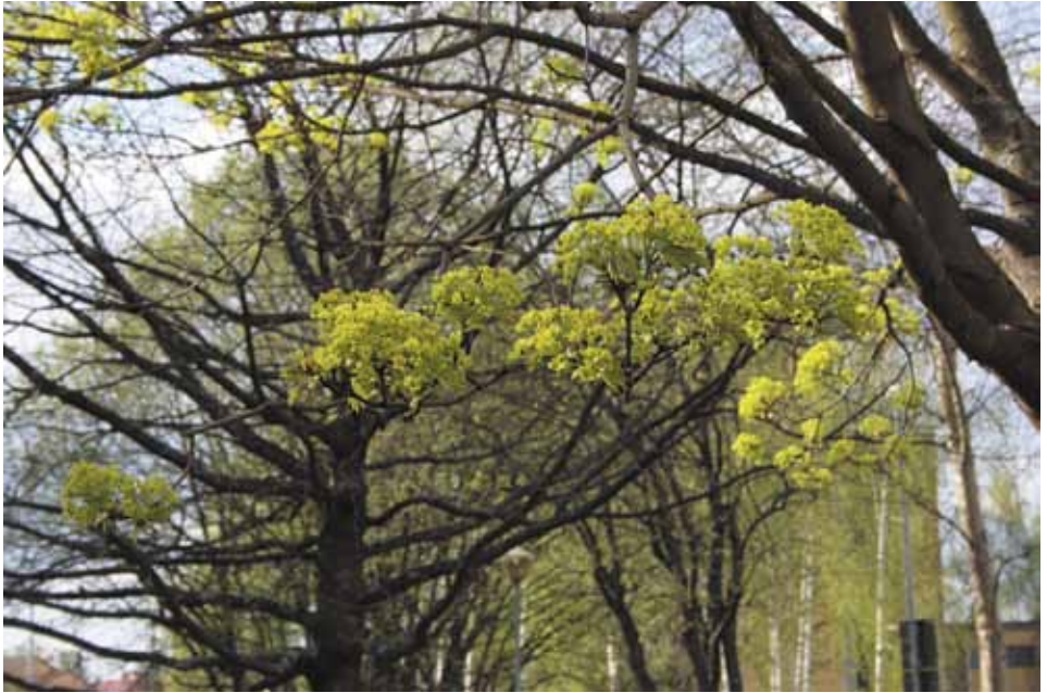
© Marja-Liisa Torniainen Kalevan vaahterat 2008 - digikuva