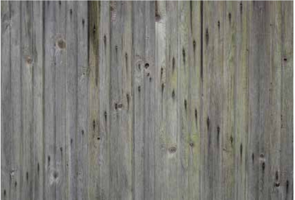
© Marja-Liisa Torniainen - Kirje maalta 2009 - digikuva