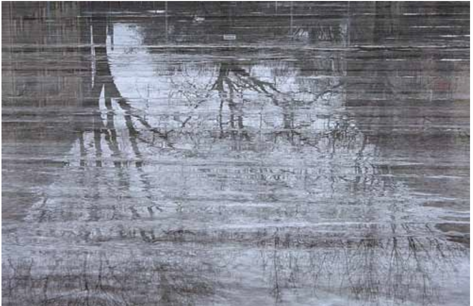
© Marja-Liisa Torniainen Kaleva-sarja: Ilmastonmuutos - Luistinrata helmikuussa 1. Digitaalinen väripigmenttiviedos 40 x 60 cm, 2009