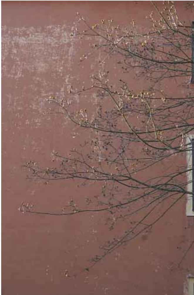
Kevät Pyynikillä - digikuva 2008