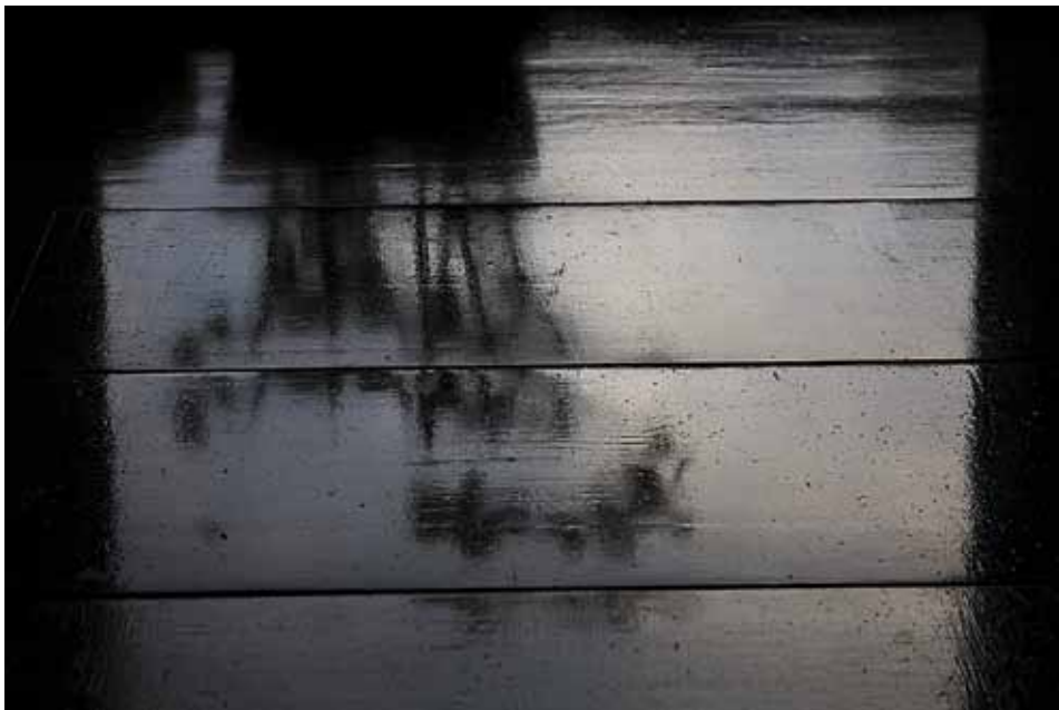
© Marja-Liisa Torniainen - Heijastus 2008, 70 x 100 cm digitaalinen väripigmenttiviedos 2009