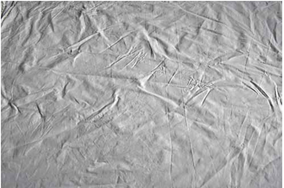
© Marja-Liisa Torniainen - Lakana, 2008 70 x 100cm, digitaalinen väripigmenttiviedos 2009