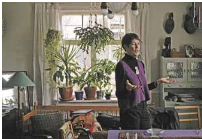
HASSIN ja VALJAKAN EKOTALO A-LUOKITUK- SELLA PISPALASSA s.4