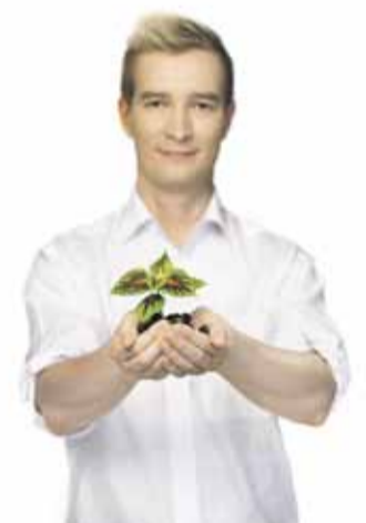
ORAS TYNKKYKEN kolumni s. 2