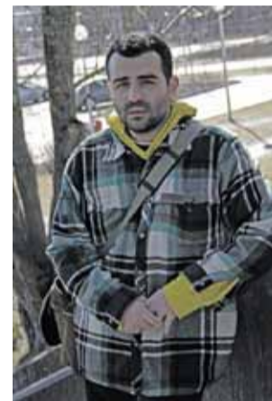
KARIM MAICHEN HAASTATELU s. 6