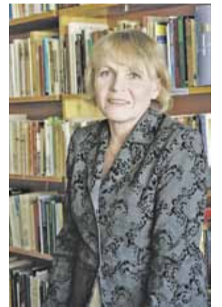
KANSOJEN TALO TAMPEREELLE s. 5.