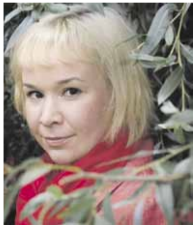
"PÄIVITTÄISMEDIA TYHMIS- TÄÄ" s. 3